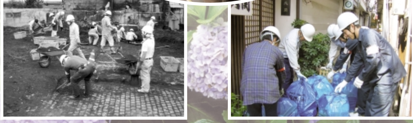
H20.4.21 飯塚市本町他商店街で火災が発生。火災被害者の会とともに、延べ800人を超えるボランティアが復興を応援しました。

《発行》飯塚市社会福祉協議会 〒820-0011 飯塚市柏の森956番地4 TEL0948-23-2210 FAX0948-23-2262