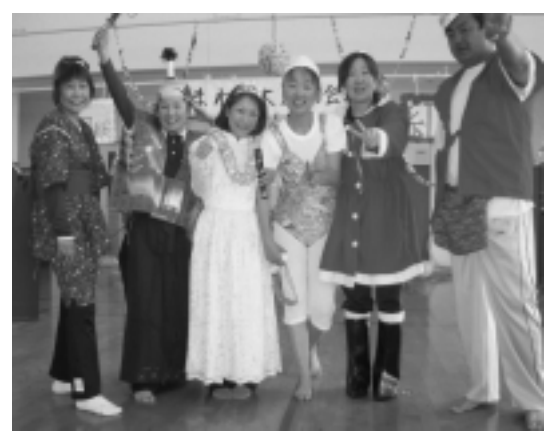
<5月誕生会での様子>