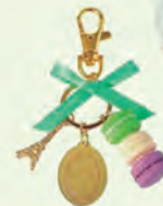
マカロンキーホルダー作り