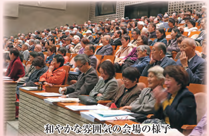
和やかな雰囲気の会場の様子