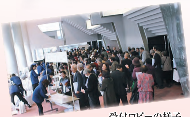
受付ロビーの様子