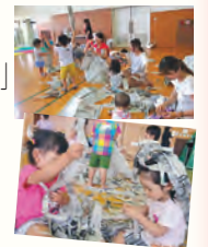
☆新聞ビリビリ遊び☆