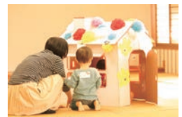
お菓子のおうち作り