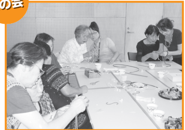
みんなで手芸をして楽しみました