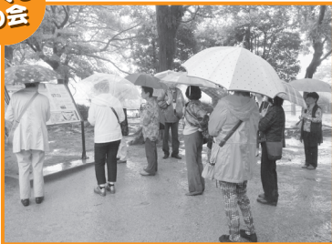
福岡城址を見学してリフレッシュしました