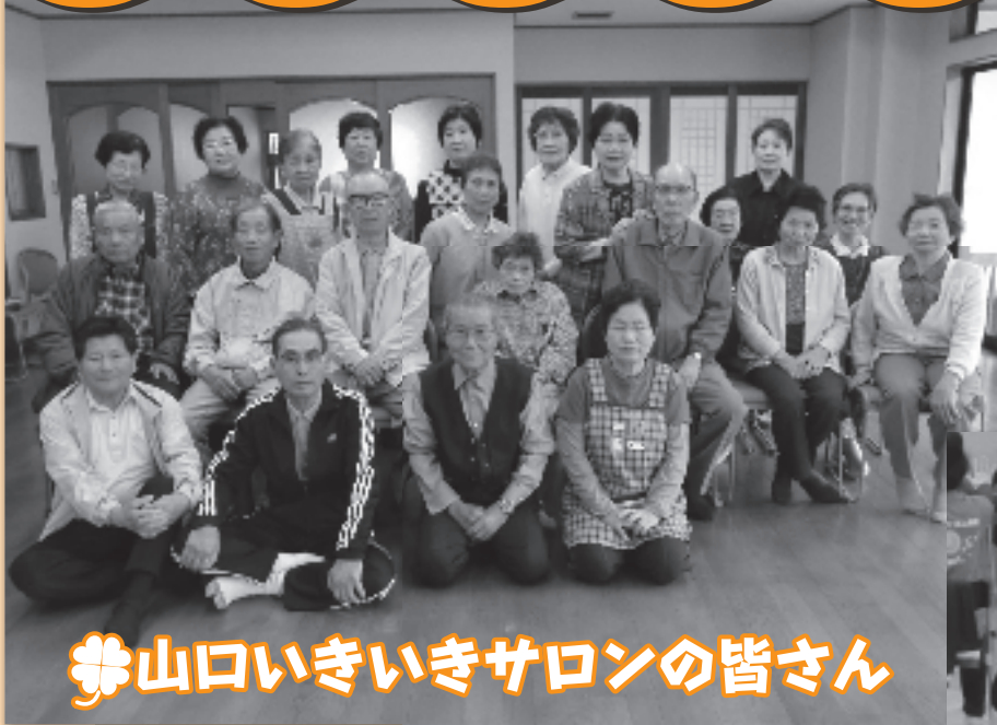
✿山口いきいきサロンの皆さん

三郡山のふもとにある、茜染めで有名な「山口自治会」です。昨年より「介護予防」を中心としたサロンを行っています。