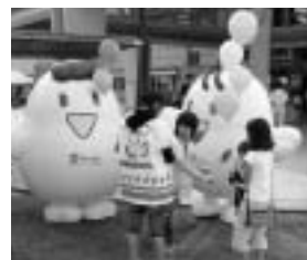
共同募金のマスコット「愛ちゃん」と「希望くん」