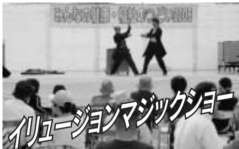
次々と繰り出されるマジックに 目が釘付けになりました!!

「みんなの健康・福祉のつどい2006」を通して世代の違いや障がいのあるなしにかかわらず、誰もが平等でお互いを認め合える福祉のまちづくりを市民の皆さんとともに考えてもらえるひとつの機会になったのではないかと思います。