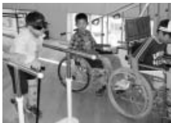
(高齢者擬似体験・車いす体験)

10月15日(日)筑穂保健福祉総合センターを会場に、実行委員さんのご協力のもと「みんなの健康・福祉のつどい2006」が盛大に行われました。