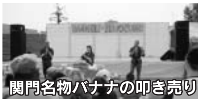
関門名物バナナの叩き売り

10月15日(日) 天候に恵まれ、「みんなの健康・福祉のつどい2006」をコスモスコモンで開催し6,000人の来場者で会場はにぎわいました。