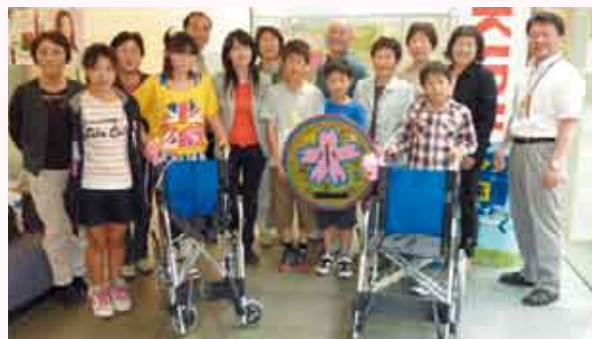
筑穂収集ボランティアの皆さんと内野小6年生のみなさん