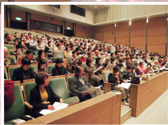
各地で活躍する皆様(350人)